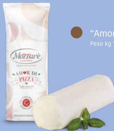
● “Amor di pizza” filone Peso kg 1