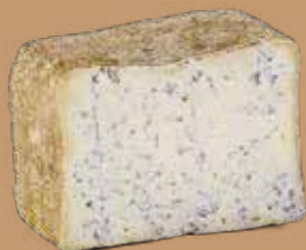
● Blu di bufala Peso kg 2