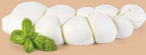
● Treccia di bufala Campana DOP Peso gr 125, 250, 500, fino a kg 3