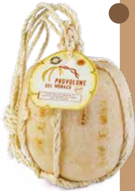
● Provolone del monaco DOP Peso kg 3,5