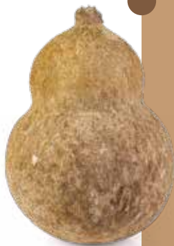
● Caciogrotta Peso kg 1,7