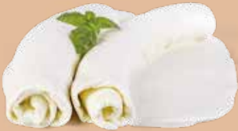
● Sfoglia di bufala Campana DOP Peso gr 800