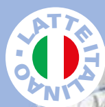
● Mozzarella Deliziosa Peso gr 30, 125, 250