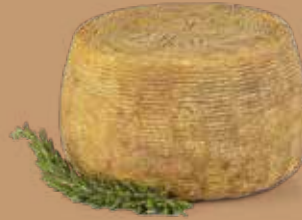
● Pecorino Bagnolese Peso kg 2 circa