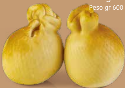
● Caciocavallo affumicato di Agerola Peso gr 600