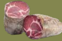
Capocollo Peso kg 1,5 circa