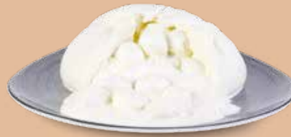
● Figliata di bufala Peso gr 500, kg 1