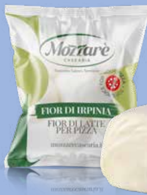
● Fior di latte “Fior di Irpinia” Peso gr 500