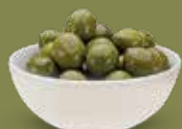
Olive verdi di Nocellara del belice in salamoia Peso kg 5