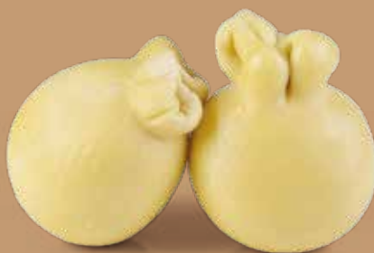
● Caciocavallo morbido di Agerola Peso gr 600