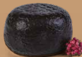
● Caciotta di bufala Peso gr 400