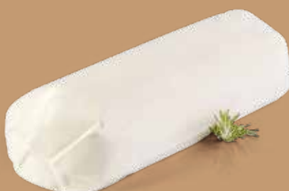
● Filone di scamorza Peso kg 2