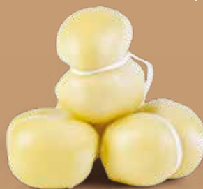
● Scamorzine di Agerola Peso gr 170