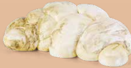
● Treccia affumicata di latte di bufala Peso gr 125, 250, 500, fino a kg 3