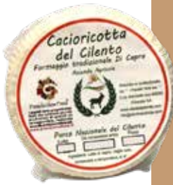
● Cacioricotta del Cilento Peso gr 250, Box kg 2,5