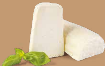
● Ricotta di pecora salata stagionata Peso gr 400 Box Kg 2,5