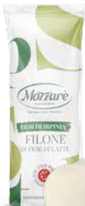
Fior di latte filone "Fior di Irpinia" Peso kg 1