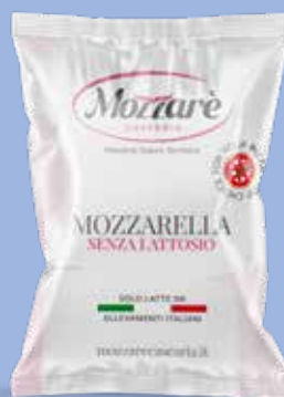
● Mozzarella senza lattosio Peso gr 125, Box Kg 2