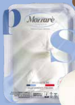
Burrata Pugliese Peso gr 50, 100, 125, 200