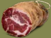
Capocollo di Martina Franca Peso kg 2,2 circa