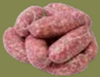
Salsiccia Napoletana Peso gr 110 Box Kg 2,2