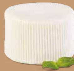
● Cacioricotta di pecora Peso gr 300 Box Kg 3