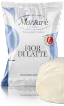
● Fior di latte del Matese Peso gr 500