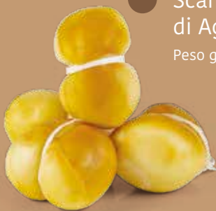
● Scamorzine affumicate di Agerola Peso gr 170