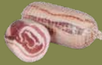
Pancetta Piacentina DOP arrotolata Peso kg 2,3