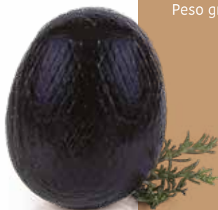
● Caciocavallo di bufala Peso gr 900