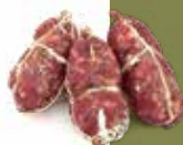
Salame Mugnano del Cardinale Confez. Kg 4