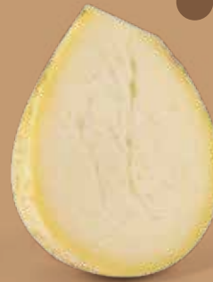
● Caciocavallo Podolico Peso Kg 2