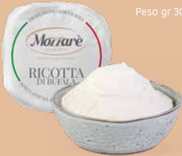
● Ricotta di bufala classica in carta Peso gr 300