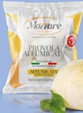
● Provola affumicata "Mozzarè" Peso gr 500