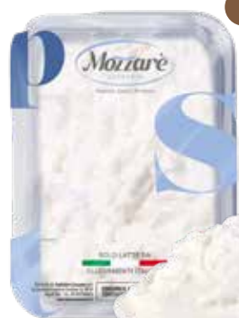
Stracciatella Pugliese Peso gr 250