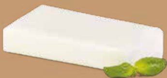
● Burro di bufala Peso gr 125 Box kg 1,250